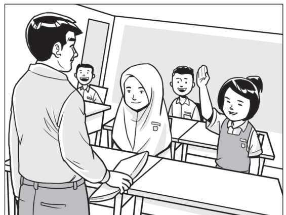
Belajar di Bawah Satu Bumbung