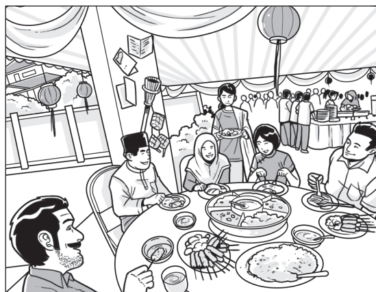
Mengadakan Majlis Rumah Terbuka 1Malaysia