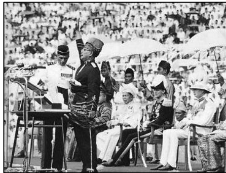
Tunku Abdul Rahman mengisytiharkan pemasyhuran kemerdekaan Tanah Melayu