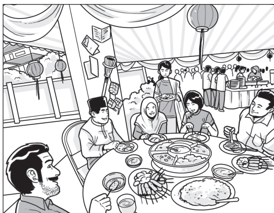
Mengadakan Majlis Rumah Terbuka 1Malaysia