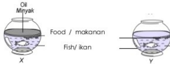
Diagram 1 Rajah 1